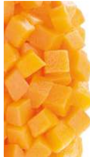
CALABAZA EN CUBOS CALABAZA PELADA Y CORTADA 500Gr