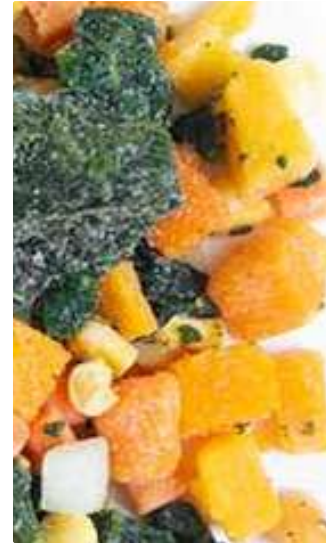
MIX SOPA ESPINACA, ZAPALLO, ZANAHORIA, PAPA, TOMATE, CHOCLO, PUERRO PEREJIL 500Gr