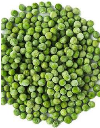
ARVEJAS ARVEJAS CONGELADAS 500Gr