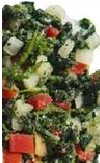
MIX DE TARTA ESPINACA, CEBOLLA, MORRON 500Gr