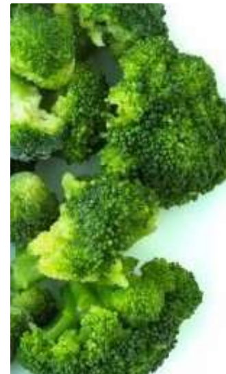
BROCOLI BRÓCOLI CONGELADO 500Gr