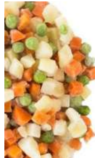
JARDINERA PAPA, ZANAHORIA, ARVEJA 500Gr