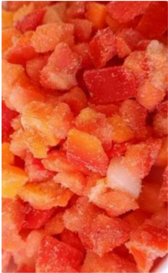
Mix SALSA DE Tomate TOMATE, CEBOLLA, ZANAHORIA Y PIMIENTO 500Gr