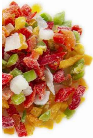
MIX DE TACOS PIMIENTO ROJO, VERDE, AMARILLO CEBOLLA 500Gr