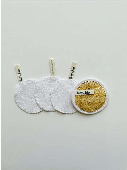
ORIGEN: MISIONES, ARGENTINA