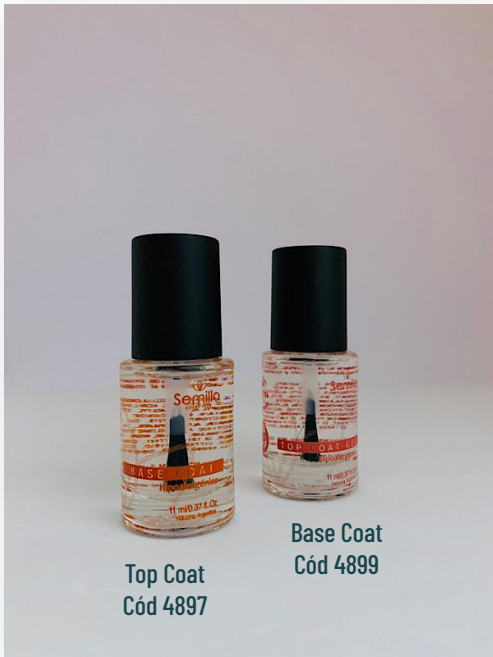
Top Coat Cód 4897