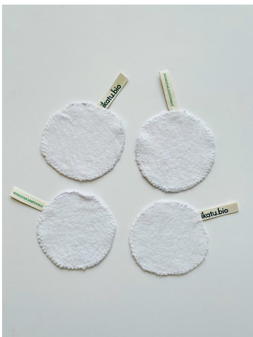
ORIGEN: CABA, ARGENTINA

Tu aporte consciente: Usar productos biodegradables, derivados de la esponja vegetal larga, que se corta y plancha y telas 100% algodón.