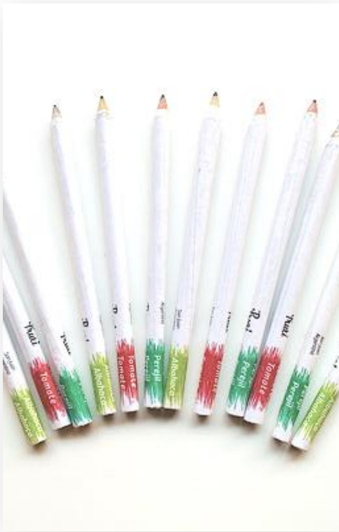
ORIGEN: SAN JUAN