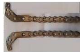
TIBIA PLACA 3.5 TIBIA PROXIMAL TK