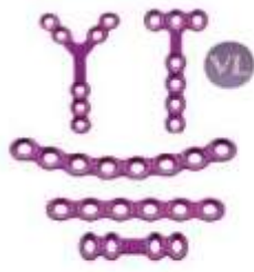
CRANEO-MAXILO-FACIAL 1.5 PLACA BLOQUEADA