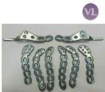
CLAVICULA CLAVICULA 3.5 TK