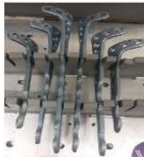
TIBIA PLACA 3.5 Tibia distal TK