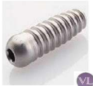
ARTROSCOPIA TITANIO INTERFERENCIAL ROMO TITANIO