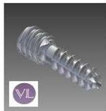
CANULADOS CANULADO 2.0 Tipo Barouk