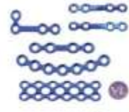
ORFEBRÓLOGICA 2.0 PLACA BLOQUEADA $0,00 LEER MÁS