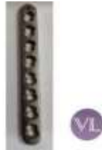
FRAGMENTOS PEQUEÑOS 3.5 PLACA DCP BLOQUEADA