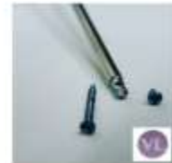
ORFEBRÓLOGICA 2.0 CORTICAL CRUZ 0.50 $0,00 LEER MÁS