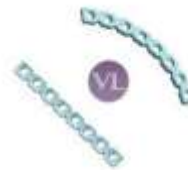
FRAGMENTOS PEQUEÑOS 3.5 PLACA DCP MODELO VL