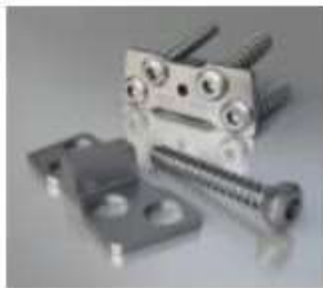
TIBIA 6.5 PLACA PUDDU