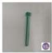
ORFEBRÓLOGICA 2.0 PIN bloqueado TK $0,00 LEER MÁS