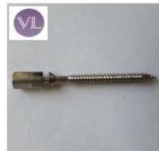
FRAGMENTOS 2PEQUEÑOS PIE Sistema Twist-off tonillos 1.5 y 2.0 descabezable