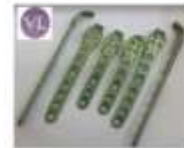
FRAGMENTOS PEQUEÑOS 3.5 PLACA olécranon Pollaxial TK