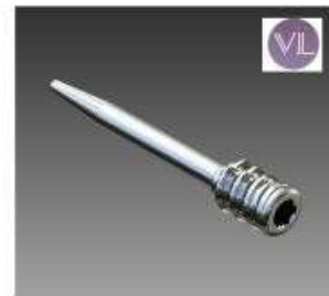
ARTROSCOPIA TITANIO TRANSFIXIANTE