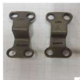
FRAGMENTOS 2PEQUEÑOS PIE Placa escalonada Titanio Bloqueada