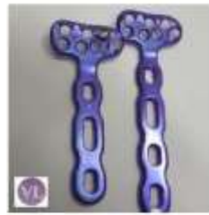
FRAGMENTOS 2PEQUEÑOS MÚFCA PLACA VOLAR 3.0 Doble Hilera k