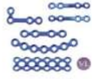
ORFEBRÓLOGICA 2.0 PLACA COMUN $0,00 LEER MÁS