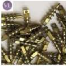
ARTROSCOPIA TITANIO ARPON TIT CONEXION EXTERNA