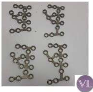
FRAGMENTOS 2PEQUEÑOS PIE PLACA 3.5 CALCANEO TK