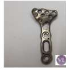
FRAGMENTOS 2PEQUEÑOS MÚFCA PLACA VOLAR Triple hilera VL