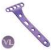
FRAGMENTOS 2PEQUEÑOS MÚFCA PLACA VOLAR 3.0 (SIMPLE HILERA) K