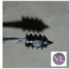
ARTROSCOPIA TITANIO ARPON TIT CONEXION INTERNA