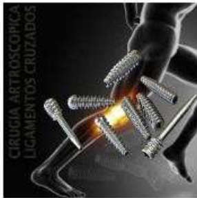
ARTROSCOPIA TITANIO INTERFERENCIAL HTH TITANIO