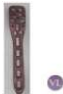
FRAGMENTOS PEQUEÑOS 3.5 PLACA PHILO TK