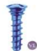
ORFEBRÓLOGICA 2.0 BLOQUEADO CRUZ 0.50 $0,00 LEER MÁS