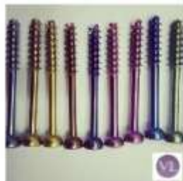
CANULADOS CANULADO 3.5 ROSCA PARCIAL