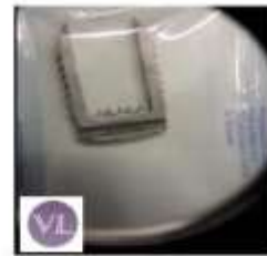
ARTROSCOPIA TITANIO Grapa