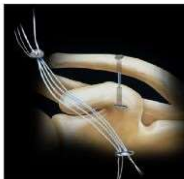
CLAVICULA ENDOBOTTON TITANIO Acromio Clavicular