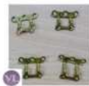
ORFEBRÓLOGICA 2.0 PLACA MENTÓN → LEER MÁS