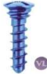
CRANEO-MAXILO-FACIAL 2.0 BLOQUEADO CRUZ 0.50