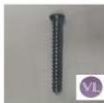
CANULADOS CANULADO 3.5 ROSCA TOTAL