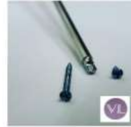
CRANEO-MAXILO-FACIAL 2.0 CORTICAL CRUZ 0.50