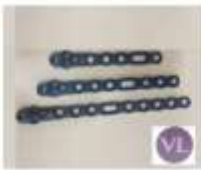
FRAGMENTOS PEQUEÑOS 3.5 PLACA Perone