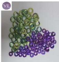
CANULADOS ARANDELA Titanio