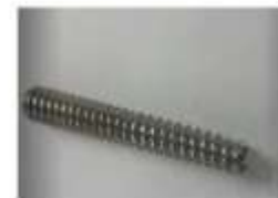
CANULADOS CANULADO 3.5 VARITECH FT